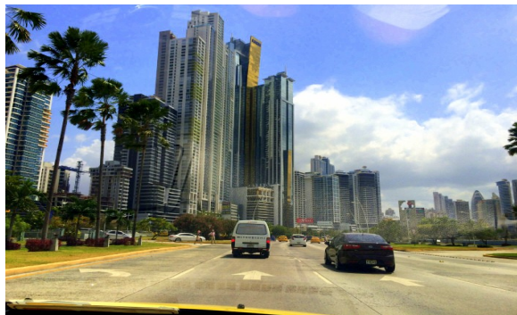
Panama városban sajnos nem idézhattunk sokat

Mint mindig itt is kevesebbet maradtunk mint szerettünk volna. Egy éjszaka alatt átvitorláztunk a Panama csatorna bejáratához Colon-ba. Napkeltére értük el a kikötő bejáratát és hajóóriások között szalomoztunk be a gigantikus kőgátak védelmébe. A Panama csatornát az amerikaiak építették, de a kilencvenes évek elején visszaadták az üzemeltetését Panamának. A világ műszaki csodáinak egyike. Még most is az eredeti elektromechanikus berendezések működtetik a zsilipeket. Semmi számítógépes vezérlés. Már vannak akkora konténerszállító hajók, melyek nem férnek be a zsilipekbe. Nekik most épülnek az újak.