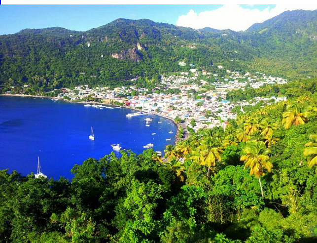
A város a másik oldalról

Az ünnepekkel megérkezett az ún. karácsonyi szél. Ez nem más mint a felerősödött passzát szél, ami éjjel-nappal egy irányból szinte azonos erővel fúj ettől kezdve hónapokon át. El is kísért minket a teljes karib tengeri utunkon egészen Panamáig.