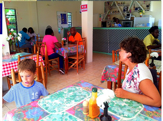
Ebéd a helyiekkel. Kerülnék a túristás helyeket. Itt bejött!