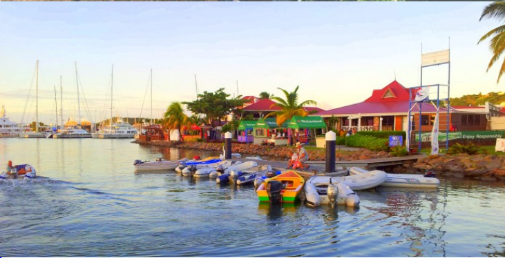
Rodey Bay Marina csónakkikötő