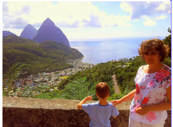
Soufriere város háttérben a Pitonokkal

A népek keveredése ma is intenzíven zajlik. Az angolok és hollandok hátra hagyták egykori gyarmataikat, de földrajzi közelsége és klímája miatt a karibi térség olyan az USA és Kanada lakosságának mint az európaiaknak az Adria vagy a görög szigetvilág. Egy nagyszerű hely ahová el lehet menekülni a tél hidege és a civilizáció vadhajtásai elől. Vannak akik csak egy-egy hétre mennek, de sok apróbb sziget ma már gazdag családok magántulajdona. Itt nyaral a nyugdíjas amerikai tanár, ide jár a kanadai kisvállalkozó, de egyre több nyugat európai is itt bérel vitolást. Láthattuk több, a mediából és az internetről ismert orosz milliárdos hajóját is. Az egyik legnagyobb az Eclipse, Abramovics hajója mellettünk horgonyzott Szt. Bárths egyik öblében. Egyik horgonyva is többet ért a mi egész hajónknál.