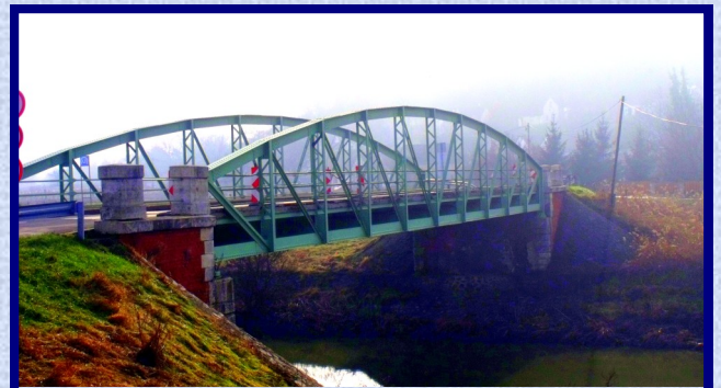
Legnagyobb álmunk már a célegyenesben...